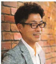
ミナト経営株式会社 代表取締役