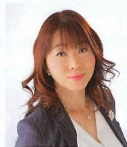
(株)シー・マインド 代表取締役

中小企業診断士。直接的に経営に参加させて頂く経営コンサルティングや幹部研修、従業員研修のみならず、間接的なご支援として経営者が学べる場『ミナト経営塾』を継続的に主催。いろいろな側面から地域を盛り上げられるよう取り組んでいる。